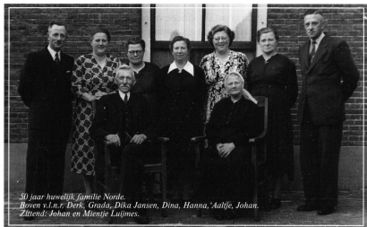
50 jaar huwelijk familie Norde.

Nadat de familie Norde van het boerderijtje in Delden vertrokken was, liet de baron het afbreken; zo radikaal was hij! Alleen de pomp en een aantal vruchtbomen hebben er nog lange tijd gestaan. Thans is daar weinig meer van vroegere bewoning te zien en rest slechts een lindeboom aan de kant van de weg, en de historie, die hier in het kort is vermeld.