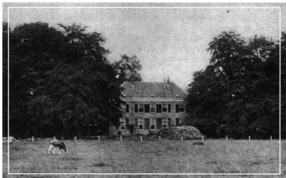
Het huis in zijn oudste vorm, nog zonder fronton en serre.