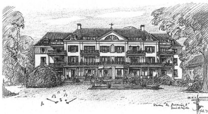
Het nieuwe appartementengebouw, ontwerp en tekening Dr.Ir. E.J. Hoogenberk.