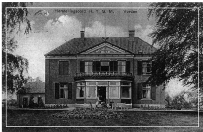
Het huis in de beginperiode van zijn herstellingsoord-bestaan.